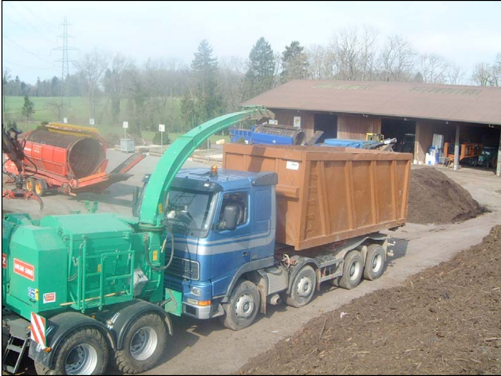
Chantier broyeur lent pour souches